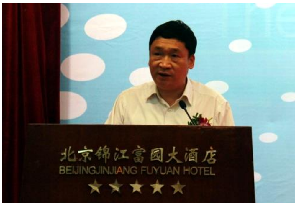
商务部市场秩序司温再兴司长致辞