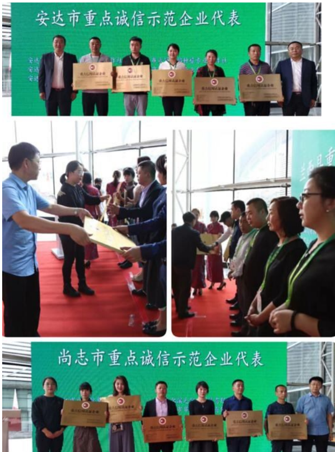
诚信企业授牌现场

在黑龙江省商务厅的指导和大力支持下，黑龙江国富融公司和国富泰信用公司密切配合，积极推动商务领域信用体系建设工作，已经取得初步成效，截至目前，累计为黑龙江地区 200 余家企业提供了信用服务，在大会上针对信用建设成果进行了展示，并对部分诚信企业进行了授牌仪式，得到了广大企业的交口称赞。