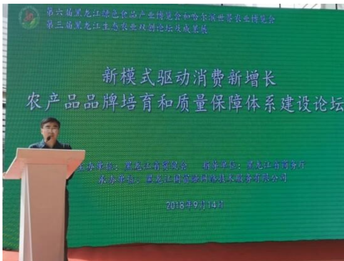
黑龙江省商务厅领导致开幕词

9月14日，由黑龙江省政府和哈尔滨市政府主办、黑龙江省贸促会承办的第六届黑龙江绿色食品产业博览会和哈尔滨世界农业博览会在哈尔滨开幕，北京国富泰信用管理有限公司（以下简称“国富泰”）应邀出席以“新模式驱动消费新增长”为主题的“农产品品牌培育和质量体系建设”论坛，并就信用体系建设促进企业发展进行了经验交流。论坛由中国国际贸易促进委员会黑龙江省委员会主办、黑龙江省商务厅指导、黑龙江国富融网络技术有限公司承办。