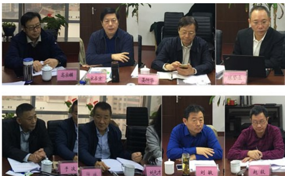
信评委听取评价工作汇报

为配合盐改的顺利实施，建立以信用为核心的新型市场监管体系，依据《关于印发社会信用体系建设规划纲要（2014—2020年）的通知》（国发〔2014〕21号）等有关规定，促进盐行业信用体系建设，提高行业企业诚信意识，增强行业自律水平，规范行业内部竞争秩序，促进行业健康发展，在国家发改委、工信部的指导下，中国盐业协会联合北京国富泰信用管理有限公司开展了食盐定点生产企业信用等级评价工作。