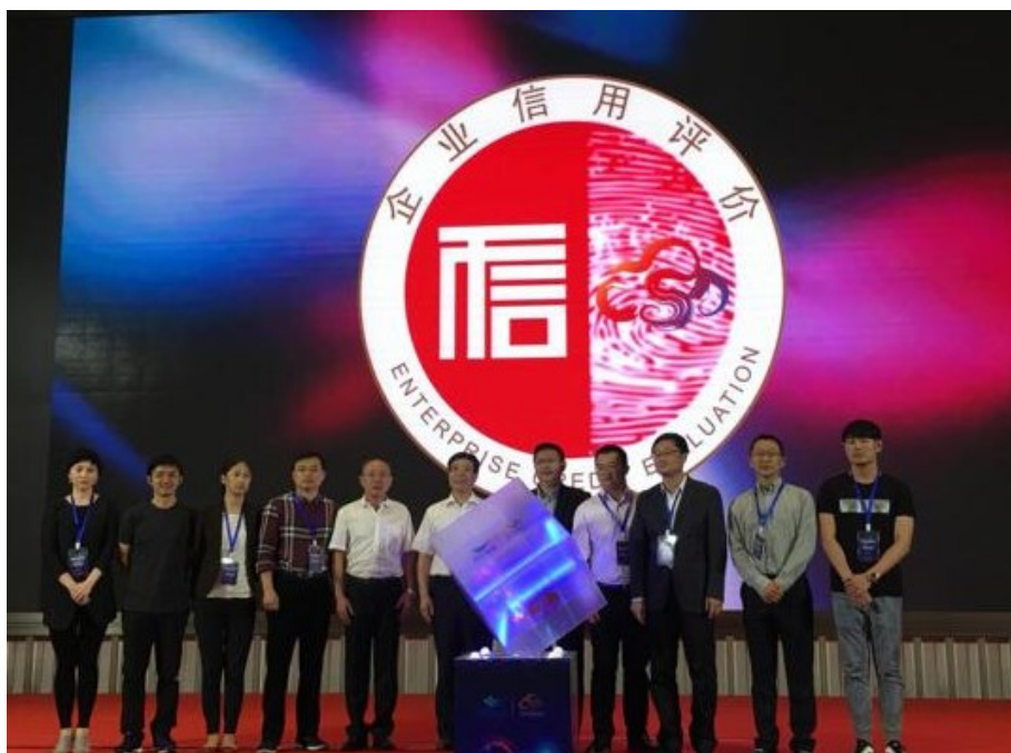
信用评价工作启动仪式

作为年会的亮点环节，协会正式启动了信用等级评价工作，9家协会会员单位成为第一批信用等级试点评价企业，获评AAA或AA级信用企业，成为中国气象行业守信企业的代表，中国气象服务协会孙健会长及陈总对9家获评单位进行了颁牌，并共同启动评价工作。