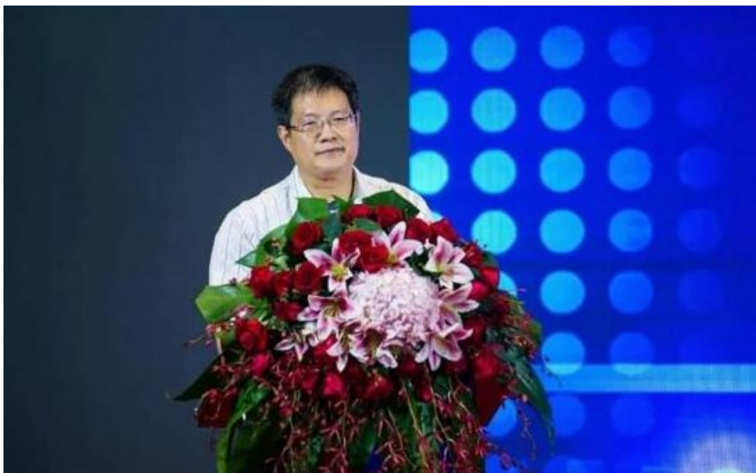
中国气象局余勇副局长致辞

由中国气象服务协会主办，深圳市气象服务中心协办“风云际会·中国气象服务协会 2017 年会”于 10 月 19 日在深圳召开，来自中国气象局、部分省（区、市）气象局领导、气象及其相关行业企业代表、相关行业协会、科研院所代表、中国气象服务协会会员单位代表共 500 余人参加了本次年会。中国气象局党组书记、局长刘雅鸣为大会发来贺信，余勇副局长出席会议并致辞。北京国富泰信用管理有限公司（以下简称“国富泰”）作为协会的信用服务机构受邀参加年会，并出席“云开·未来一畅谈天气服务创新及未来气象产业发展”圆桌对话。