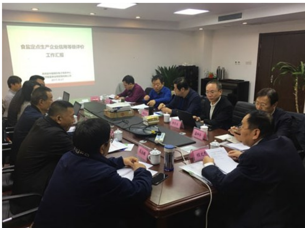
中国盐业企业信用等级评价委员会第一次会议评审现场

会上信评委听取了盐行业信用体系建设、信用评价工作的汇报，审阅了各项材料，并经过提问和答疑，认真讨论后一致认为，评价指标、评价评分办法、评价结果等工作兼顾了信用评价客观性、公正性、独立性、科学性的原则，并符合盐行业发展规律，可为相关部门制定政策与战略提供依据，有助于食盐定点生产企业进一步快速、健康发展，同意通过评审，要求国富泰在下一步的工作中，结合盐行业特点，抓住盐改的关键期，把全行业的信用评价工作做深做透，并通过信用评价工作与行业监管有效链接，促进行业健康发展。