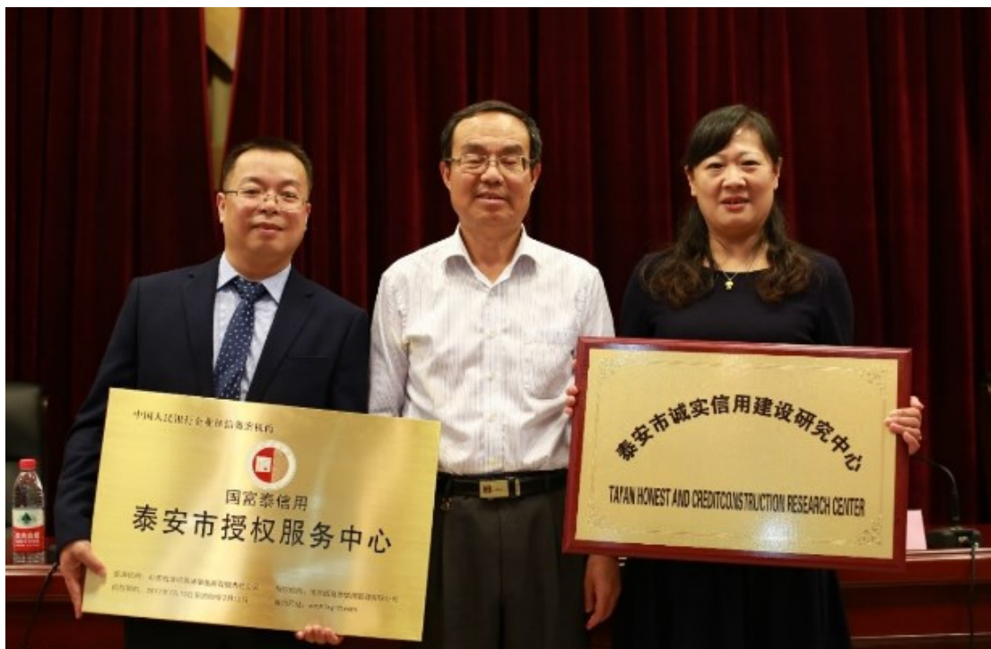
国富泰泰安授权服务中心、泰安市诚实信用建设研究中心揭牌

会上，泰安市纺织行业协会代表十家先进行业协会共同发起旨在“打造诚信行业、建设信用泰安”的《泰安市诚信行业创建活动倡议书》。同时举行了国富泰泰安授权服务中心、泰安市诚实信用建设研究中心揭牌。