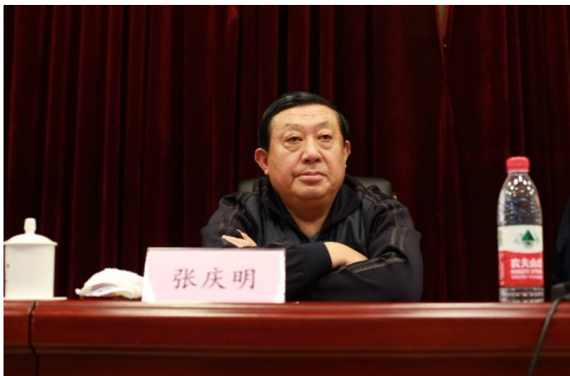
泰安市政协副主席张庆明致辞