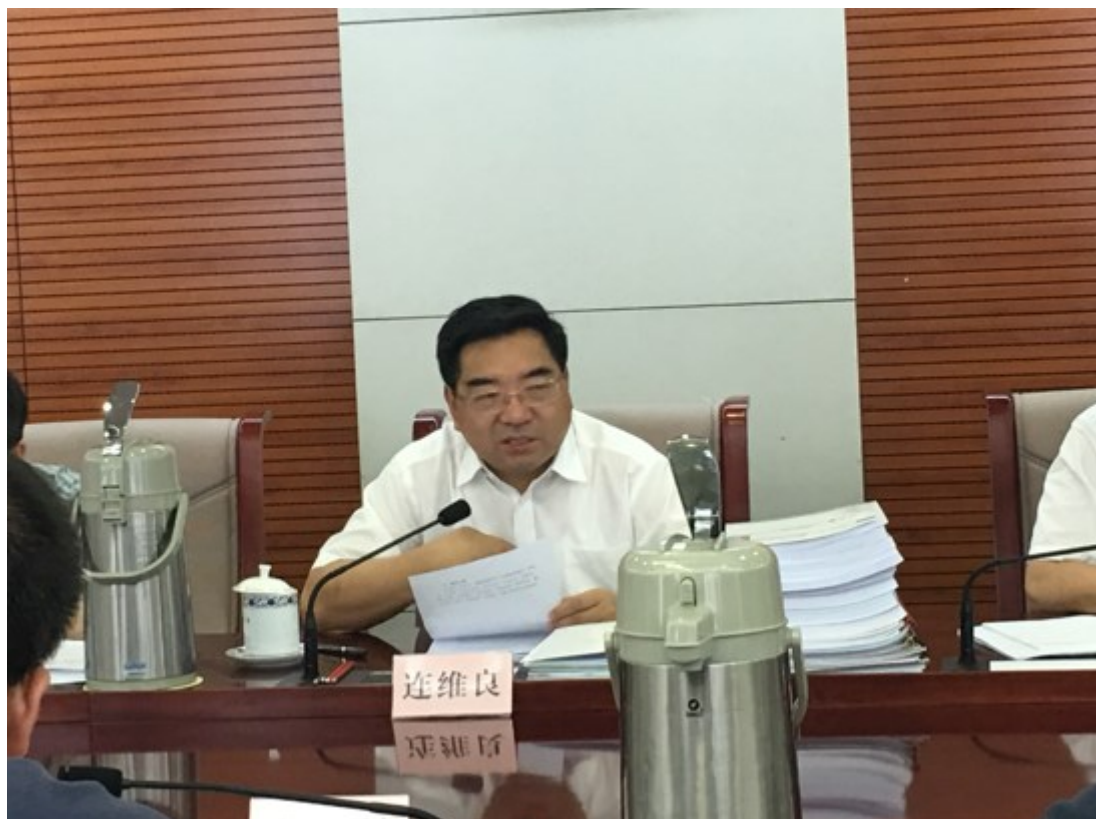
连维良副主任讲话

连维良副主任听取了财金司“双公示”第三方评估总体情况、《关于进一步完善行政许可和行政处罚等信用信息公示工作的指导意见（征求意见稿）》、在城市信用监测中建立“双公示”信息监测长效机制的具体意见以及征信机构的工作汇报后,对“双公示”第三方评估工作进行总结。