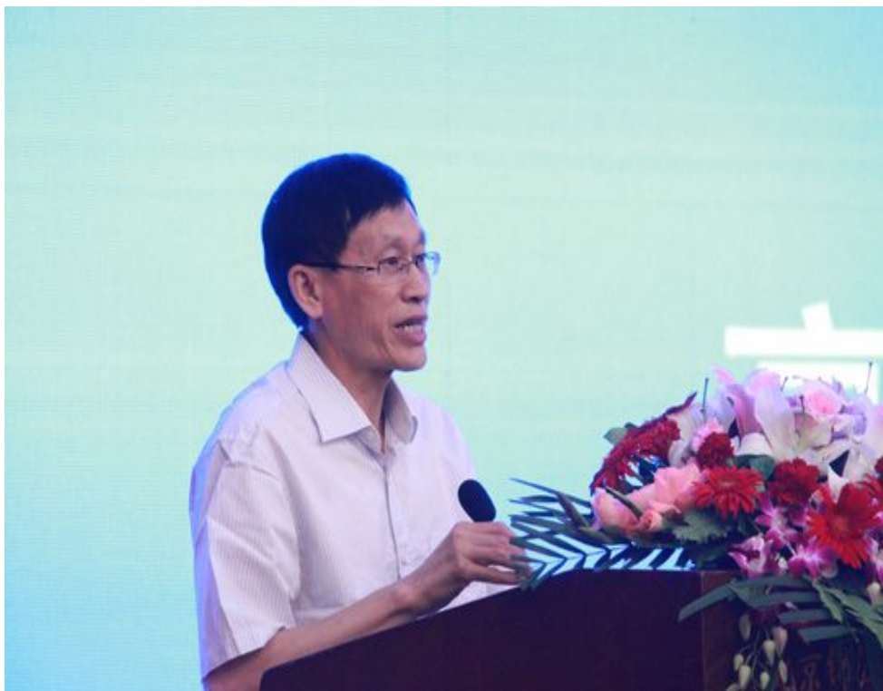
工业和信息化部消费品工业司司长高延敏致辞