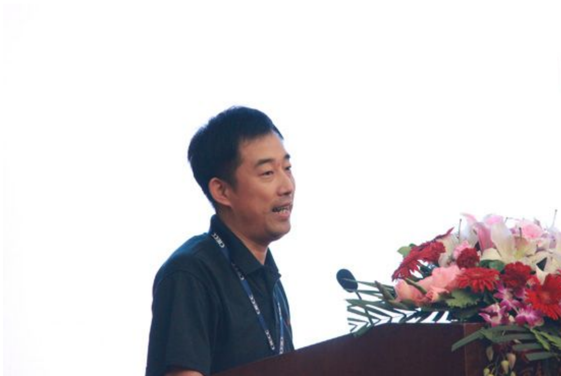
中国国际电子商务中心研究院院长李鸣涛发表政策演讲

行业信用建设是商务诚信体系中的重要板块，自 2005 年开展行业信用等级评价工作以来，已有 212 家全国性行业商协会参与到此项工作中。中国通信企业协会副会长赵中新、中国教育装备行业协会主任李守国分别从创新行业信用评价工作、规范行业信用评价管理模式、推动信用评价结果应用等方面介绍了本行业开展信用建设的情况。