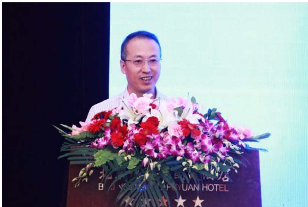
商务部市场秩序司副司长赵传义致辞