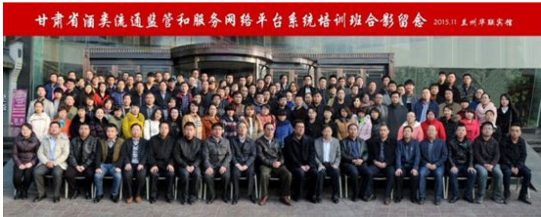
甘肃省酒类流通监管和服务网络平台系统培训班合影

州、嘉峪关、金昌、白银、张掖、庆阳、陇南、酒泉、平凉、临夏 10 个市州；试点县区包括兰州三县五区及各市州选取的县区，最终在全省推广，建立甘肃酒流通信用信息体制服务政务，发展商务，促进酒流通。