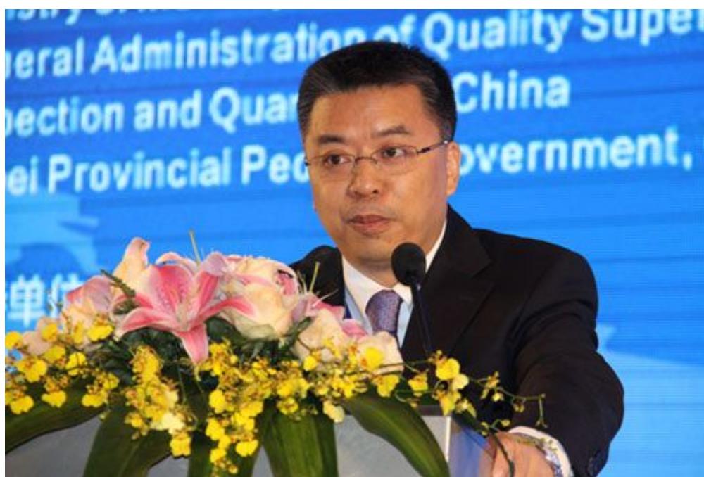
商务部部长助理童道驰出席论坛开幕式并致辞

亚太贸易便利化论坛是联合国亚太经社会推动亚太地区贸易便利化和电子商务发展的重点项目。自 2009 年发起至今，亚太贸易便利化论坛共举办了 7 届。中心与联合国亚太经社会合作，在中国成功举办了 2013 年和 2015 年两届论坛。