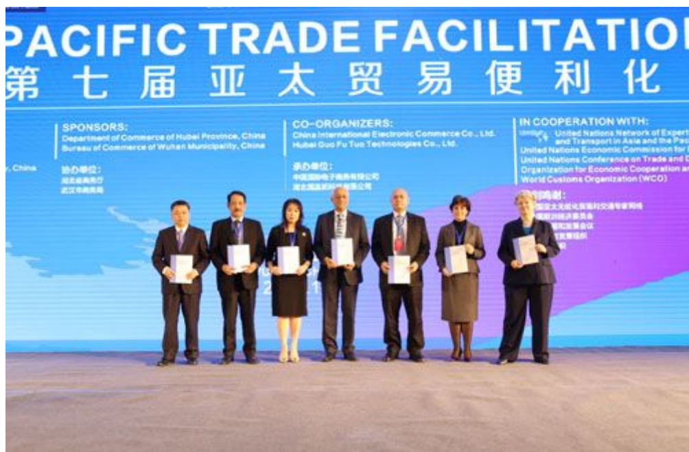
联合国亚太经社会发布《贸易便利化和无纸贸易实施调查-全球报告(2015版)》