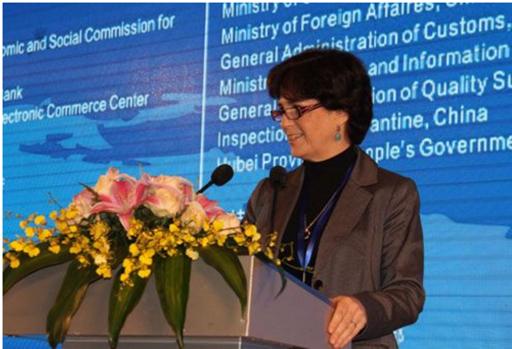
联合国亚太经社会贸易和投资部主任苏珊·斯通致辞