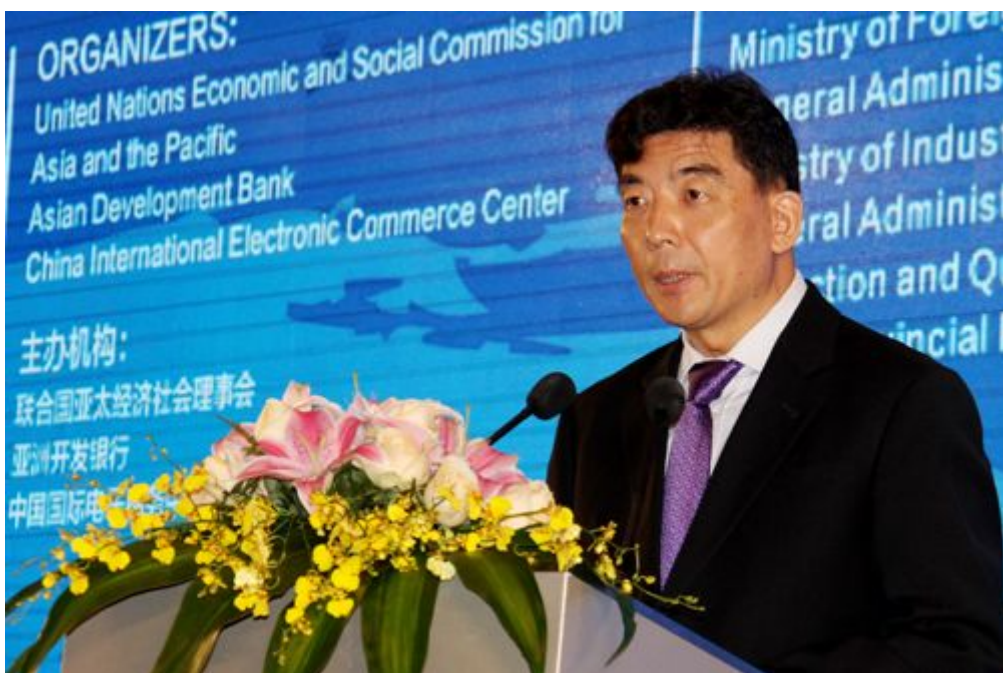
湖北省副省长曹广晶出席论坛开幕式并致辞