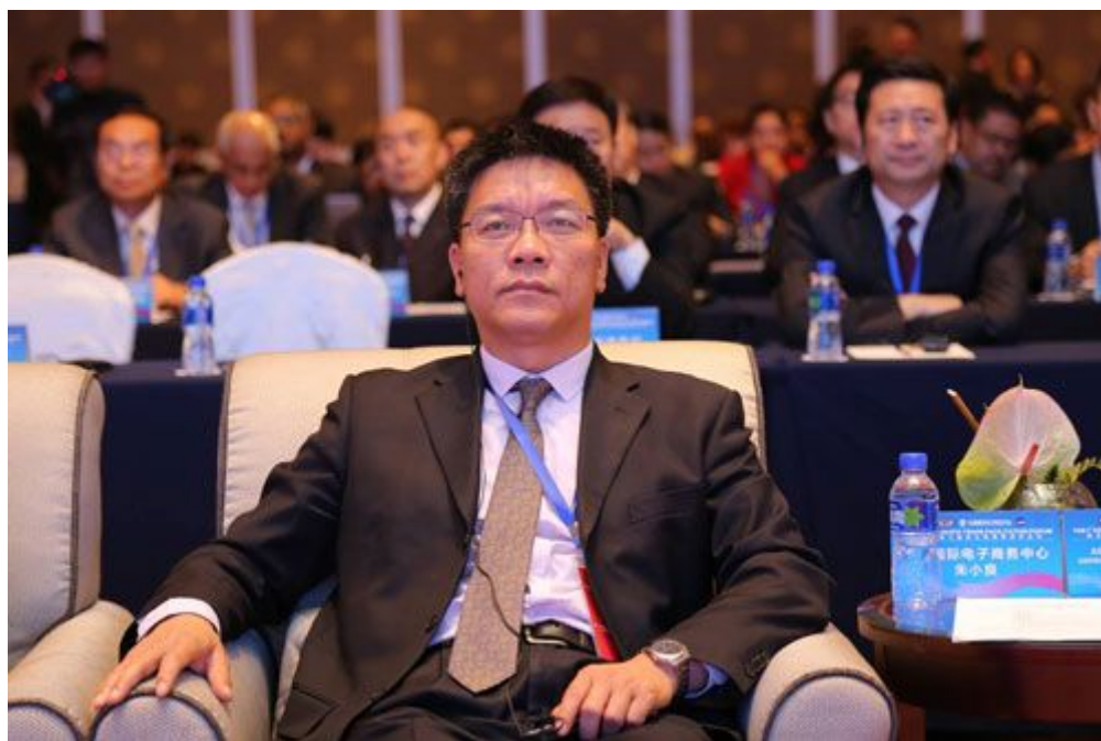
中国国际电子商务中心主任朱小良出席论坛开幕式