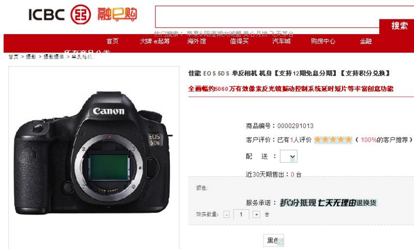
工行融 e 购商城销售的佳能单反相机