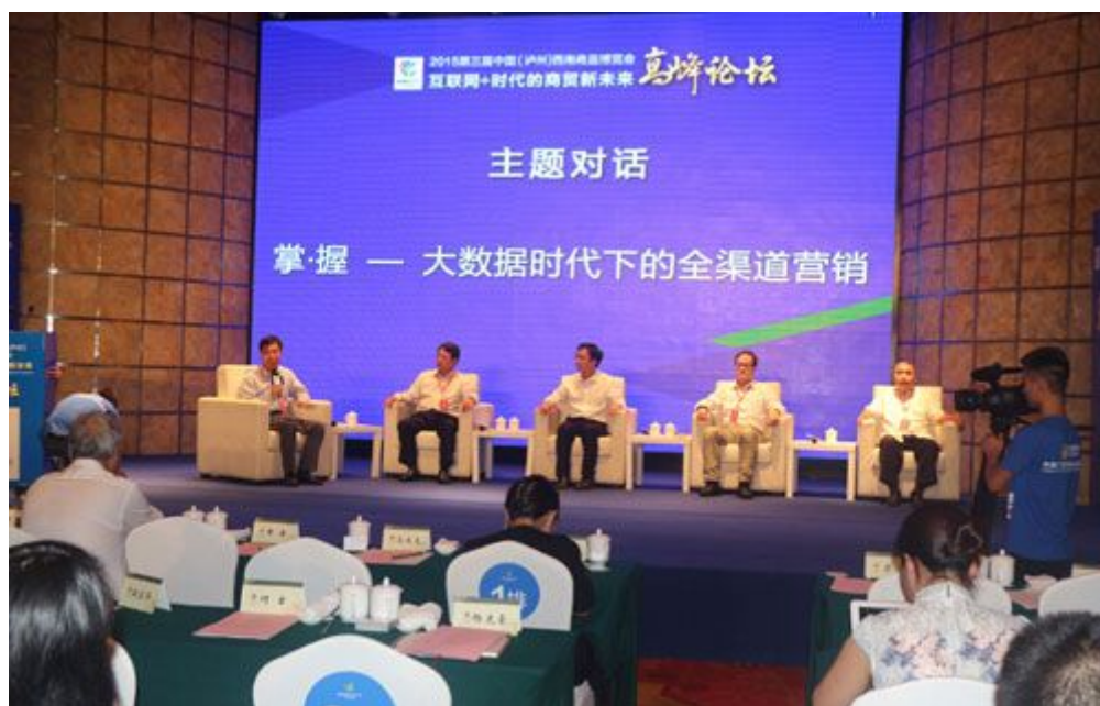
主题对话：掌握——大数据时代下的全渠道营销

来自阿里巴巴、京东、苏宁云商、成都易网等知名电商代表也在会上带来了多渠道的农村电子商务创新解决方案。各大电商平台进军西南农村电商市场的举措与创新吸引了来自川滇黔渝各地的地方主管部门及商贸流通企业代表。