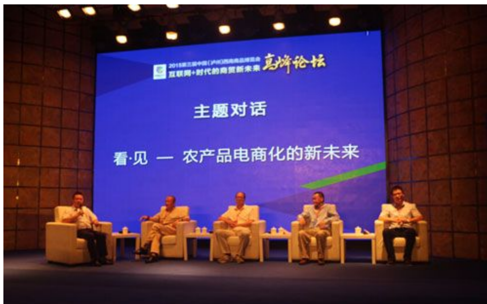
主题对话：看见——农产品电商化的新未来

此外，为促进传统产业与电子商务的融合创新，加快泸州及西南地区电子商务生态链的建设、完善，主办单位联合发起、现场举办了“全国电商战略合作-西南专场签约仪式”。电子科技大学与泸州电商中心管委会；苏宁云商集团与泸县人民政府；华东信息科技与龙马潭区人民政府从此步入战略合作模式。