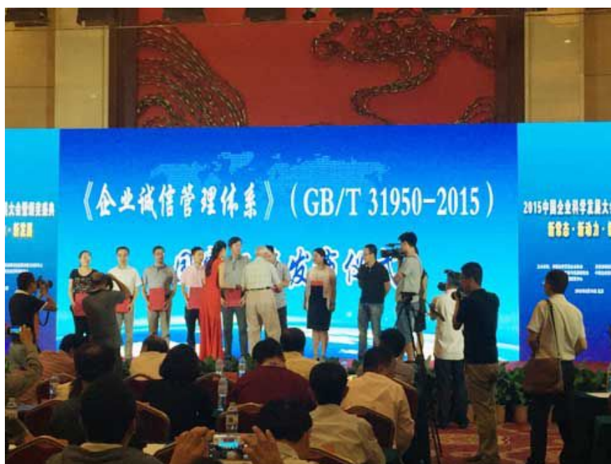
颁发标准起草单位和起草人荣誉证书

我国社会信用体系和企业信用管理的大发展时期已经大踏步到来,国富泰公司作为信用行业的重要一员,将不断开拓进取,为自身发展、行业进步和社会诚信体系建设贡献力量。