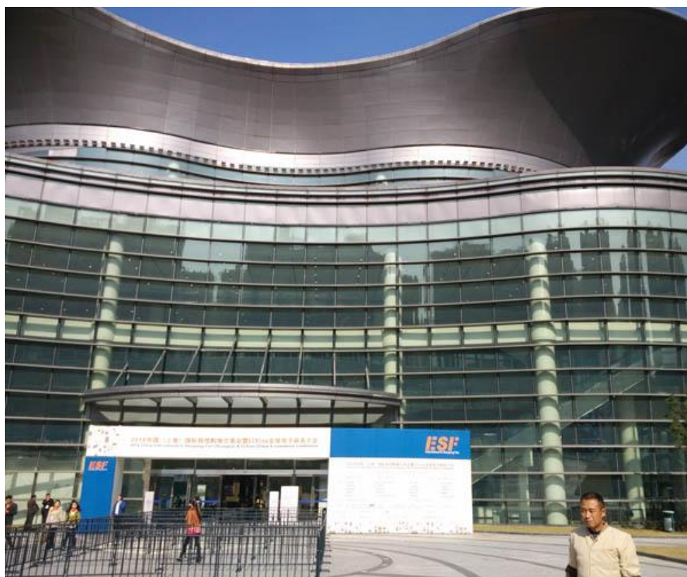
2014 中国（上海）国际网络购物交易会现场

2014 年 11 月 28—29 日，由商务部批准，上海市商务委主办，全国 19 个省市商务主管部门及上海市普陀区人民政府协办的 2014 “中国（上海）国际网络购物交易会暨 EChina 全球电子商务大会”（简称：2014EChinaExpo）在上海跨国采购会展中心成功举办。