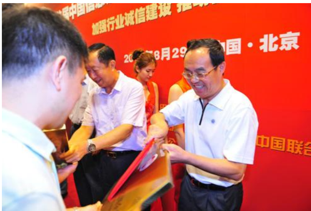
姚广海书记给企业颁发信用评价证书

中国通信设施服务股份有限公司副总经理董晓庄代表通信企业发表了致辞，并明确表示要加强信用评价结果的应用，在今后的招标程序中，将逐渐把企业信用评价结果由推荐条件转化为必要条件。