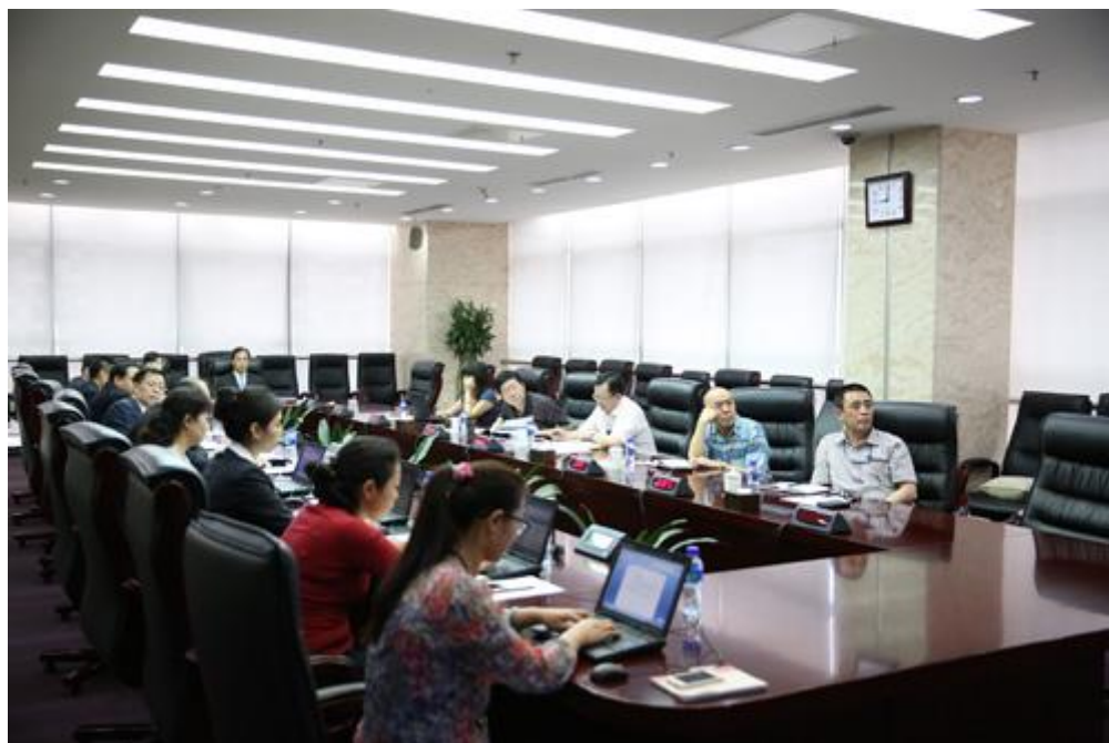
酒店召开第五届董事会第四次会议

平台为零售商的品控和供应商信用管理提供了有效工具，通过汇集、整合分散在各个零售商和供应商的证照资质信息，建立供应商电子档案，形成中央级证照数据库，服务零供行业发展。