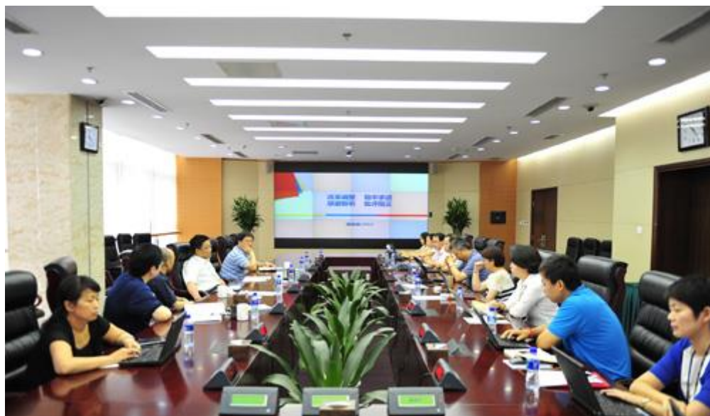
国富通公司召开第四届董事会第九次会议

国富安公司 2014 年上半年业务呈现良性进步，机构和人员调整和精细化核算初见成效，市场化收入占比逐步提高，亏损同比明显减少，但年度预算执行率仍偏低。董事会要求，公司经营班子要统一思想、团结协作、真抓实干，巩固核心技术优势，积极开拓市场，加大培训力度，强化绩效考核，提升全员的责任心和执行力，全力以赴完成年度预算目标，确保实现扭亏为盈。