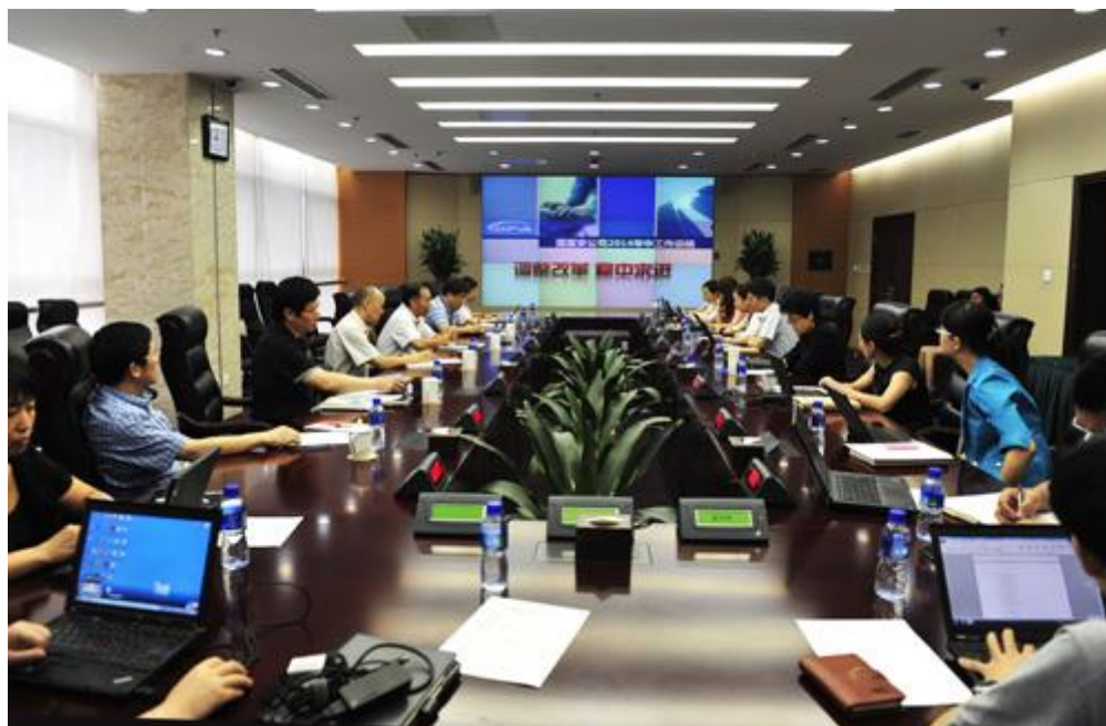
国富安公司召开第四届董事会第五次会议